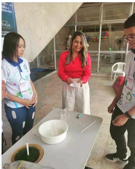
Figura 8 - Estudantes da Escola Estadual José Loureiro conduzindo o experimento eletrização por atrito no Sinpete/Ufal (2022)

Naturalmente os corpos são neutros, ou seja, possuem a mesma quantidade de prótons e elétrons, quando esse número se torna diferente dizemos que o corpo está eletrizado.