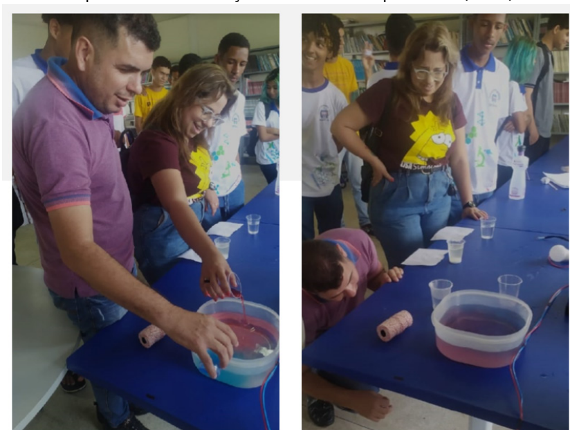
Figura 7 - Estudantes da Escola Estadual José Loureiro conduzindo o experimento convecção térmica no Sinpete/Ufal (2022)

A convecção térmica é uma das formas de propagação do calor que ocorre nos líquidos e gases. Recebe esse nome porque a transmissão do calor acontece por meio das correntes de convecção circulares que se formam por conta da diferença de densidade entre os fluidos.