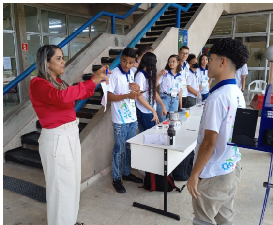
Figura 4 - Estudantes da Escola Estadual José Loureiro conduzindo experimentos queda livre no Sinpete/Ufal (2022)

A Figura 4 exibe o cenário em que os estudantes executaram o experimento com o público a fim de fazer essa constatação.