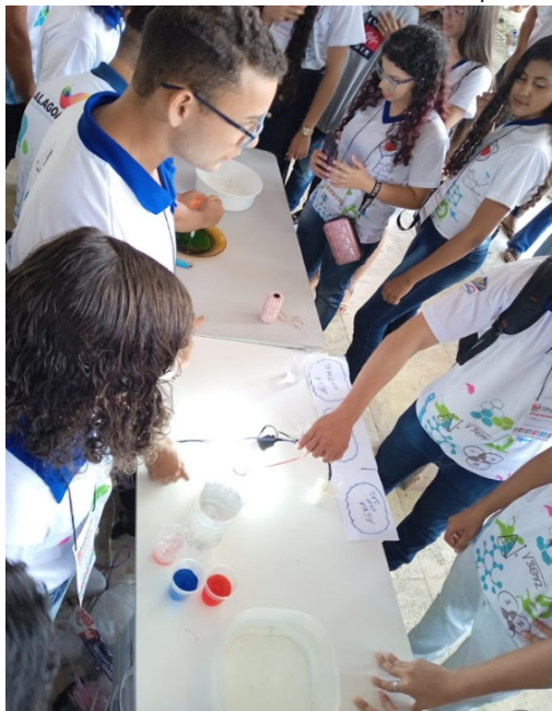
Figura 1 - Estudantes da Escola Estadual José Loureiro realizando experimentos de condutividade elétrica no Sinpete/Ufal (2022)

Na Figura 1 , temos a realização de um aluno experiente que teve todas as instruções necessárias orientadas pelo professor e direção, em que ele realizou o experimento no Sinpete para o público em geral.