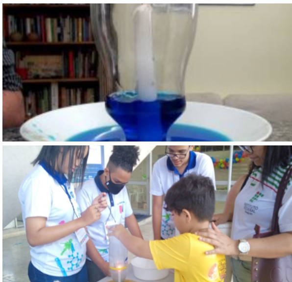
Figura 5- Estudantes da Escola Estadual José Loureiro conduzindo o experimento intervenção à vela que faz a água subir no Sinpete/Ufal (2022)

Esta experiência tem relação com a pressão atmosférica. Pressão atmosférica é a pressão que o ar da atmosfera exerce sobre a superfície do planeta e que pode mudar de acordo com a variação de altitude, ou seja, quanto maior a altitude menor a pressão e, conseqüentemente, quanto menor a altitude maior a pressão exercida pelo ar na superfície terrestre.