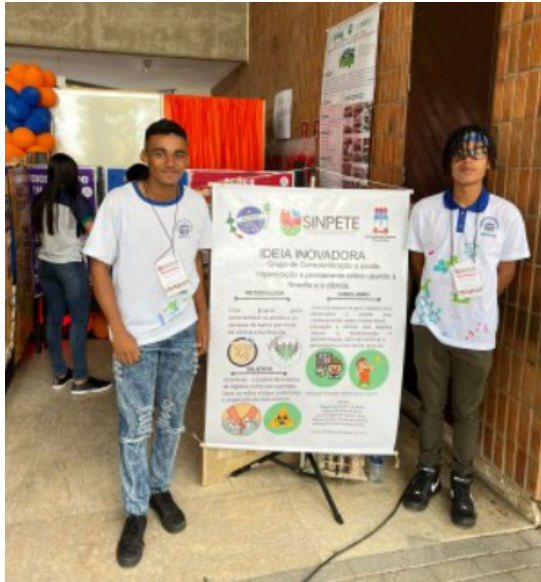
Foto A - Estudantes ao lado do banner da ideia inovadora no Sinpete