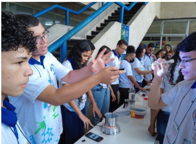
Figura 6 - Estudantes da Escola Estadual José Loureiro conduzindo o experimento do espectroscópio no Sinpete/Ufal (2022)

Visualizar a composição espectral (ou cromática) de um objeto luminoso.