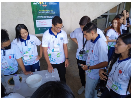
Figura 3 - Estudantes da Escola Estadual José Loureiro conduzindo experimentos de densidade no Sinpete/Ufal (2022)

A Figura 3 ilustra a realização desse experimento no Espaço Temático do Sinpete/Ufal, em interação com os visitantes.