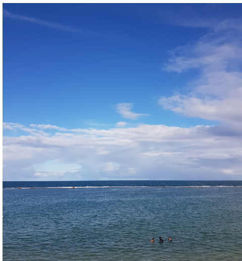
Figura 8 - Água salgada

Então, encontro meu amigo querido mar e compartilho com ele minhas correntes doces e ele, por sua vez, as suas ondas salgadas. Eu me alegro quando a gente se encontra.