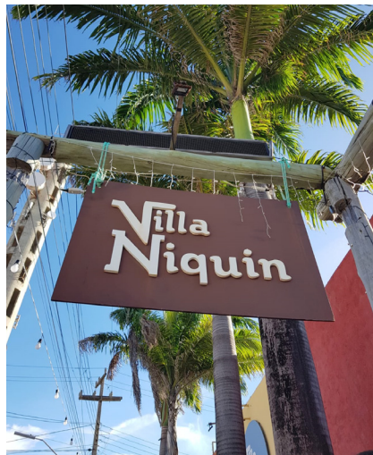
Figura 5 - Vila Niquim

As barracas ao meu redor sempre acumulam muita sujeira e impurezas. Todo esse lixo cai em mim e fica preso nas raízes e plantas.