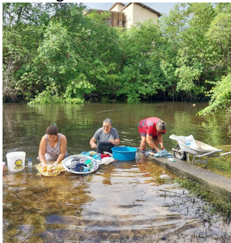
Figura 6 - As lavadeiras

O sabão e os produtos de limpeza fazem mal a mim e aos meus amigos também, pois acabam prejudicando até as pessoas que bebem da minha água.