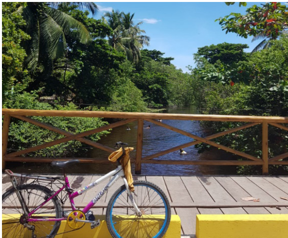
Figuras 2 e 3 - Ponte sobre o Rio Niqim