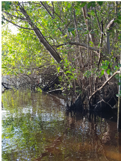
Figura 9 - O mangue

Também o esgoto da redondeza que cai em mim acaba afetando todo o ambiente, prejudicando a saúde das pessoas e dos animais que vivem lá.