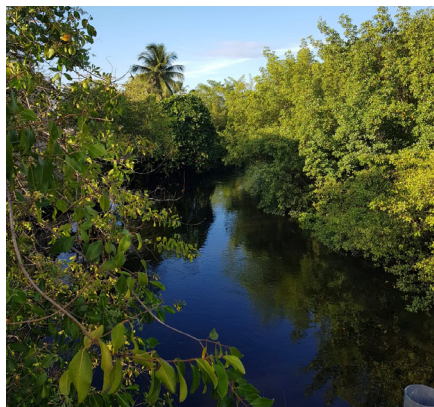
Figura 7 - Um longo caminho

As redes jogadas acabam ficando presas nas raízes, os peixes ficam presos e feridos, tadinhos!