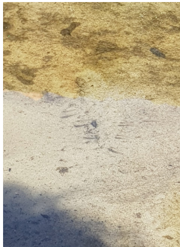
Figura 4 - Os Peixes

Eu fico um pouco triste, mas sei que alguns não fazem por mal.