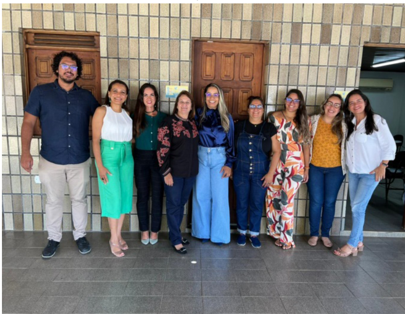
Foto 1 - Equipes da Secretaria da Educação da Barra de São Miguel e do Sinpete/Ufal