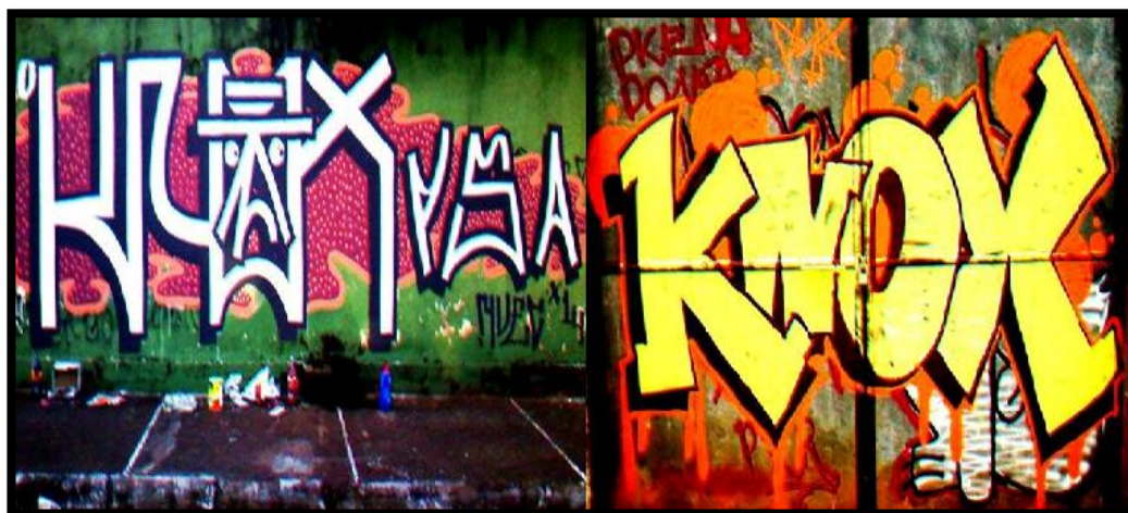
Figura 05. Pichações em Goiânia/GO

Ao reproduzirem suas escrituras esses sujeitos performam no sentido de que assumem um pseudônimo, suas técnicas se repetem mas nenhuma performance é igual a outra, pois existe uma mudança no ambiente e na escrita ocasionando diferentes resultados. Como acrescenta Schechner (2006, p. 4) “performances são feitas de porções de comportamento restaurado, mas cada performance é diferente de qualquer outra”. Similarmente, Glusberg (2003, p. 83) diz que “não há performance do tipo cópia carbono, nem repetição neste tipo de arte”.