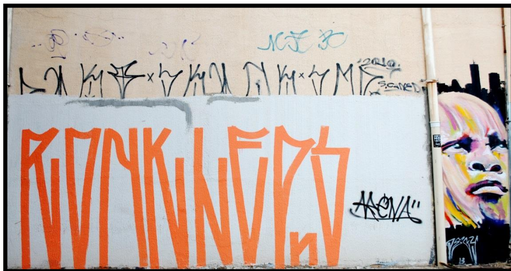
Figura 04. Outra pichação estilo tag reto feita em Goiânia/GO.

tem influência de algum pichador de outra pichação que a gente vê”. Como já dissemos anteriormente, a estética das letras de São Paulo/SP ou “Sampa” influenciam muitos pichadores.