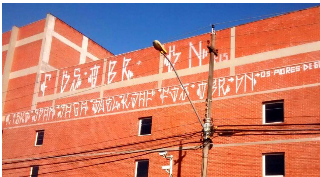
Figura 02. Pichação feita no Teatro Escola Basileu França . Fonte: Acervo Pessoal (2015).

Uma coisa que me anima é uma coisa difícil de você fazer, tipo um lugar que você vai pegar e no outro dia você vai tá no ônibus ou num carro e todo mundo vai tá parado olhando pro lugar que você pegou e conversando nossa como é que esses cara pegou aquilo, como subiram, como fizeram?. Tem cara aí que só picha muro, se eu der uma latinha pra minha avó ela picha muro.