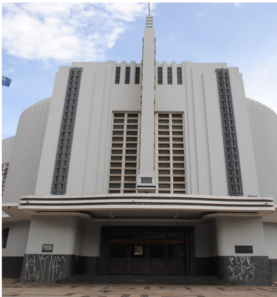
Figura 03. Pichação na fachada do Teatro Goiânia.

Diante de tais colocações, podemos entender que para esses jovens não há uma relação entre patrimônio e preservação e sim entre patrimônio e visibilidade. Os pichadores se apropriam das construções arquitetônicas de valor social de maneira distinta. Como nos demonstra (TAMASO, 2007, p. 24), não são todos os indivíduos que se apropriam dos bens arquitetônicos de forma semelhante, como relata a seguir: