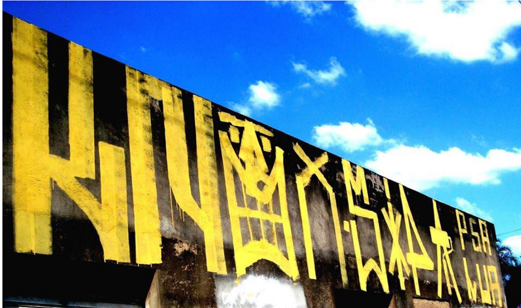
Figura 01. Pichação tag reto feita em Goiânia/GO.

As práticas de intervenção urbana (grafite/pichação) ganharam visibilidade em Goiânia/GO após o acidente radiológico com o Césio 137 no ano de 1987. Após este episódio, foi criado ainda no mesmo período um projeto intitulado Pincel Atômico, liderado pelos artistas Nonatto Coelho e Edney Antunes que tinham por objetivo pintar os muros da cidade no intuito de acrescentar mais cor a paisagem de Goiânia/GO, que acabara de sofrer um grande trauma (TAVARES, 2009). Outros artistas também se destacaram nesta época, tais como PX Silveira com seu projeto “Galeria Aberta”. Já na década de 1990, quem se destaca na cidade são Testa e Scott que impulsionaram a arte urbana com sua Crew Kães de Rua .